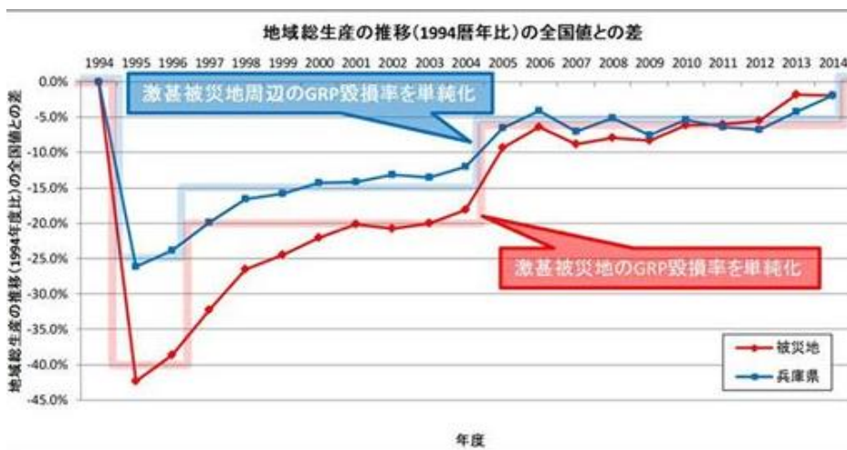
(注：全国値を規準として基準化した値の推移。推計方法の詳細は、付録1：2. (1)②参照) 図 2.1.2(1) 阪神・淡路大震災の時の、発災後20年間のGDPの推移

木学会の試算は失われる資産により悪影響を受ける地域の経済活動額を加えている為です。例えば、地震により生産施設が使えず商品供給がストップしたり、人の移住により地域消費が減少するといった地域経済活動が停滞します。地